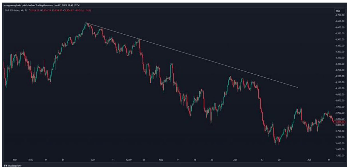
Chart provided by: Tradingview

Hier is een voorbeeld van een uptrend op de 4H timeframe, je ziet dat prijs omhoog aan het klimmen is. Hierdoor weet je dat het handiger is om naar longposities te kijken i.p.v. shortposities.